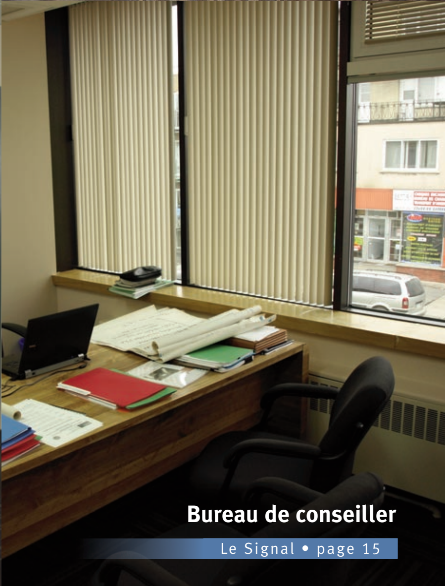
Bureau de conseiller