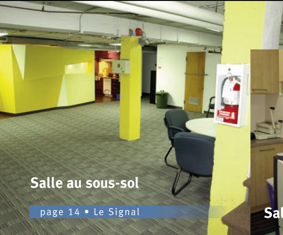
Salle au sous-sol