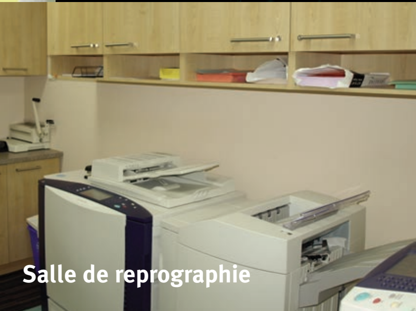
Salle de reprographie